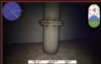
インフラ施設や大型船舶などの訓練エリア

水中ドローン特有の挙動、濁水、水の流れなどの環境だけではなく、レーザーケーブルや音響ソナーまで再現しています。リアルなバーチャル環境のなかで、狭小空間調査や濁水環境時の航行を実践的に学ぶことができます。