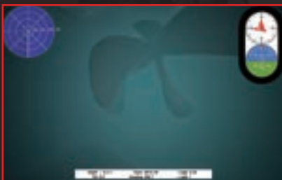
調整可能な濁度や水流