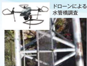
ドローンによる 水管橋調査